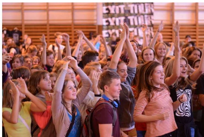
Exit Tour na středních školách

V roce 2019 bylo skrze program EXIT Tour v ČR osloveno přes 6000 studentů na středních školách.