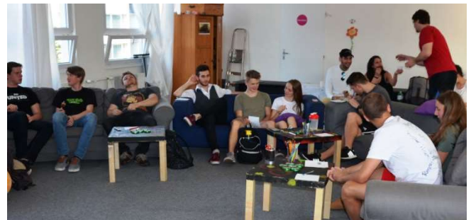
Setkání mládeže v Elimpji – léto 2019