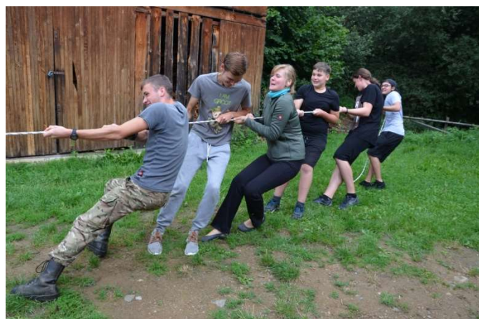
Fotografie jsou z kempu ve Zlaté Koruně 2019