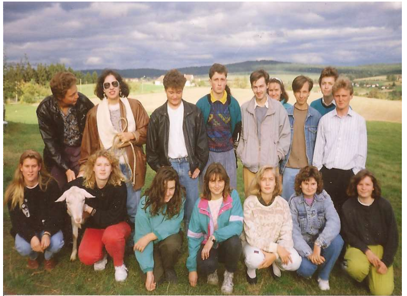
Mládež prehistorických dob v Heřmani. Poznáte někoho?