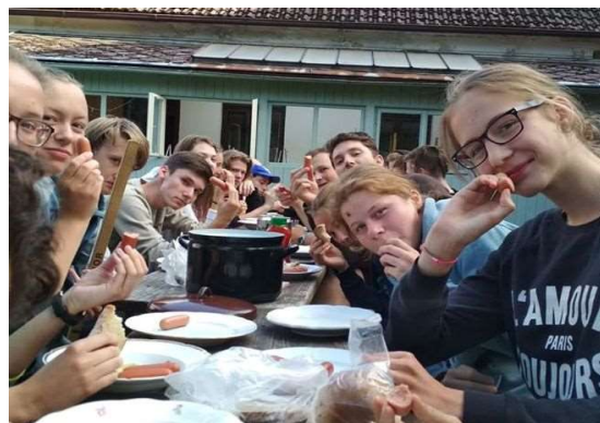
Fotografie vpravo: z pobytu mládeže 2019

Myslím, že nemusí mít z ničeho strach. Já osobně ráda poznávám nové lidi, takže já budu nadšená, a jsem si na sto procent jistá, že to tak má většina mládežníků. A je tu velká možnost, že nebude takhle „nový” sám☺. No a nejlepší bude, když zavolají Šimonovi, jeho tel. je 608 800 874, on bude velmi rád. Tímto zdravím našeho hlavního vedoucího.